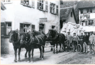
Mehlhandlung Fidel Rebholz um 1915