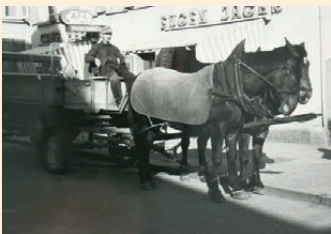
Spedition Wieland 1952