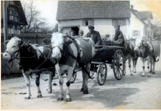
Ennetacher Fuhrwerk 1935