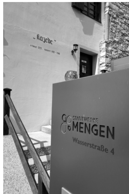
Noch ist das Sparschwein leer, aber mit den neuen Konditionen der Stadtwerke, sparen Bestandskunden und Neukunden Geld.

Grundsätzlich gilt beim Strompreis, sich nicht allein auf niedrige Kilowattstundenpreise zu verlassen, sondern auch Grundpreise zu vergleichen und die Preisschwankungen der vergangenen Jahre zu überprüfen, raten die Stadtwerke Mengen. Über drei Jahre oder länger, fahren Kunden mit ihren Stadtwerken am besten und vor allem am günstigsten. Hinzu kommt, dass die Stadtwerke auch in die regionale Infrastruktur investieren. Sie erhalten in Mengen unter anderem das Frei- und Hallenbad. Ein weiterer Vorteil der Stadtwerke Mengen ist, dass die Kunden Naturstrom erhalten, der aus der Region, teilweise sogar aus der Stadt selbst kommt.