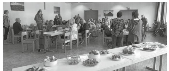
Über fünfzig große und kleine Leute waren unserer Einladung zum Frühstück gefolgt.

fen gestaltet sein. Interessierte können sich unverbindlich informieren und sich selbst ein Bild über die Aktionen in den einzelnen Teilorten machen. Die erste Schnupperwoche endete mit einem offenen Frühstücksangebot im evangelischen Gemeindesaal. Unter dem Motto Zusammen frühstücken hatte das Team der MenschenRäume ein buntes Finderfood Buffett für die zahlreichen Gäste aus nah und fern hergerichtet. Und am Ende war für alle klar: dieses gelungene Event muss unbedingt wiederholt werden.