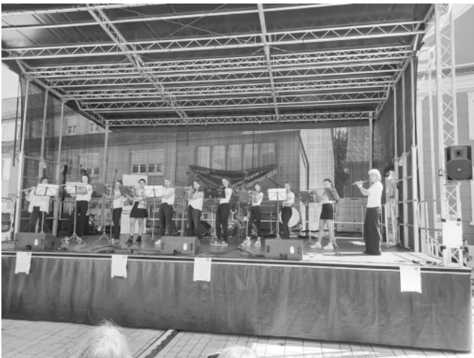
Auch Werke für Ensemble, wie hier bei den vergangenen Heimattagen, werden den Besuchern präsentiert.

Montag – Donnerstagvormittag 08.30 – 13.00 Uhr Dienstagnachmittag 13.30 – 15.30 Uhr