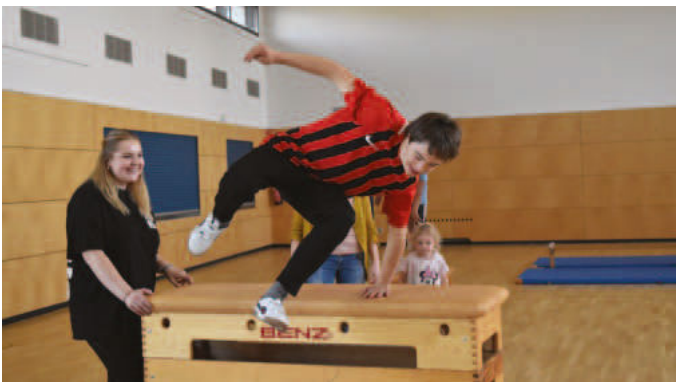
Beim Turnen haben alle Kinder, Jugendlichen und die Übungsleiterinnen Spaß.

Mengen / Immer mittwochs herrscht heiteres Treiben im Bürgersaal in Ennetach. Der Grund sind die kleinen Sportler zwischen 3 und 15 Jahren, die gemeinsam Hürden meistern. Sieben Kinder mit Assistenzbedarf turnen hier selbstverständlich mit.