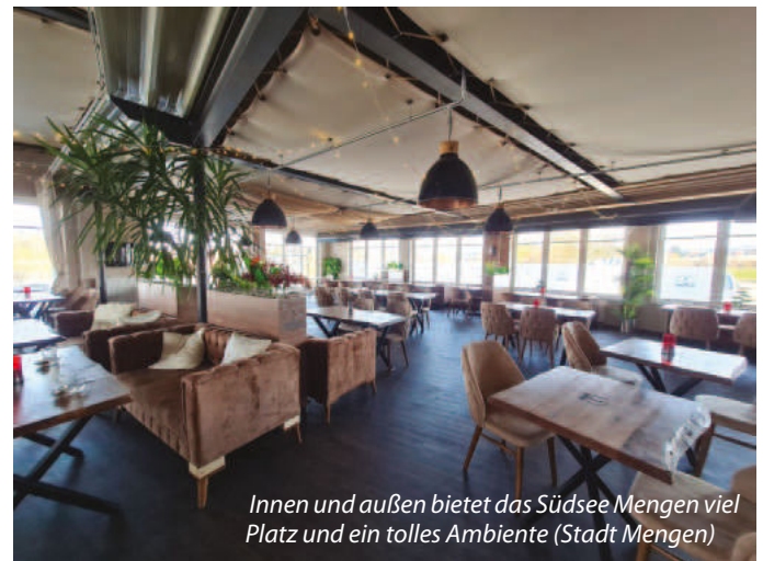
Innen und außen bietet das Südsee Mengen viel Platz und ein tolles Ambiente (Stadt Mengen)