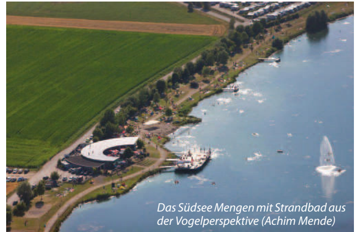
Das Südsee Mengen mit Strandbad aus der Vogelperspektive