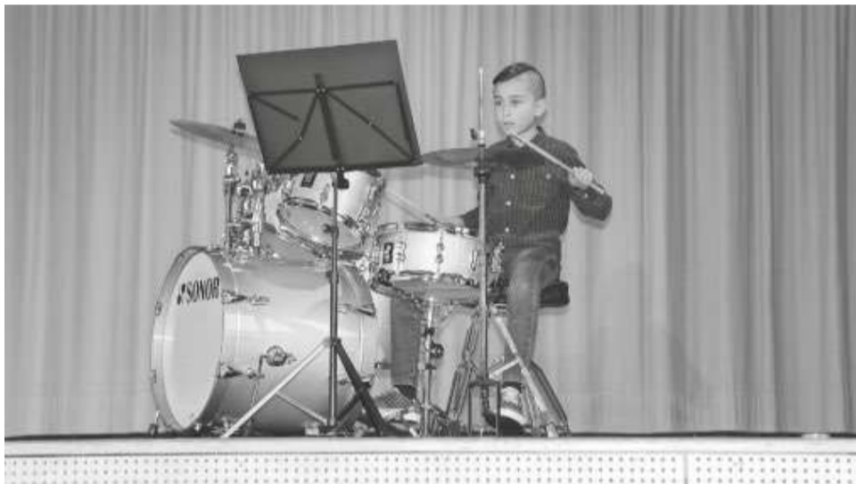
...beim Konzert am kommenden Sonntag zu hören sein.