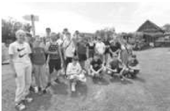
Fotos: Impressionen der Jugendkonferenz 2022 in Novska (Stadt Mingen)