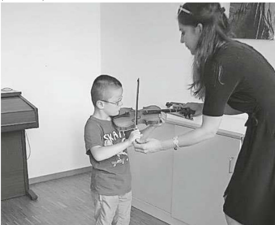
...die Möglichkeit einer Probestunde am Wunschinstrument.