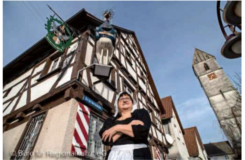
Mit Marie-Antoinettes Kammerzofe auf Entdeckungstour durch Mengen anno 1770

Bitte beachten Sie, sollte die Mindestteilnehmerzahl nicht erreicht werden, kann die Führung kurzfristig abgesagt werden.