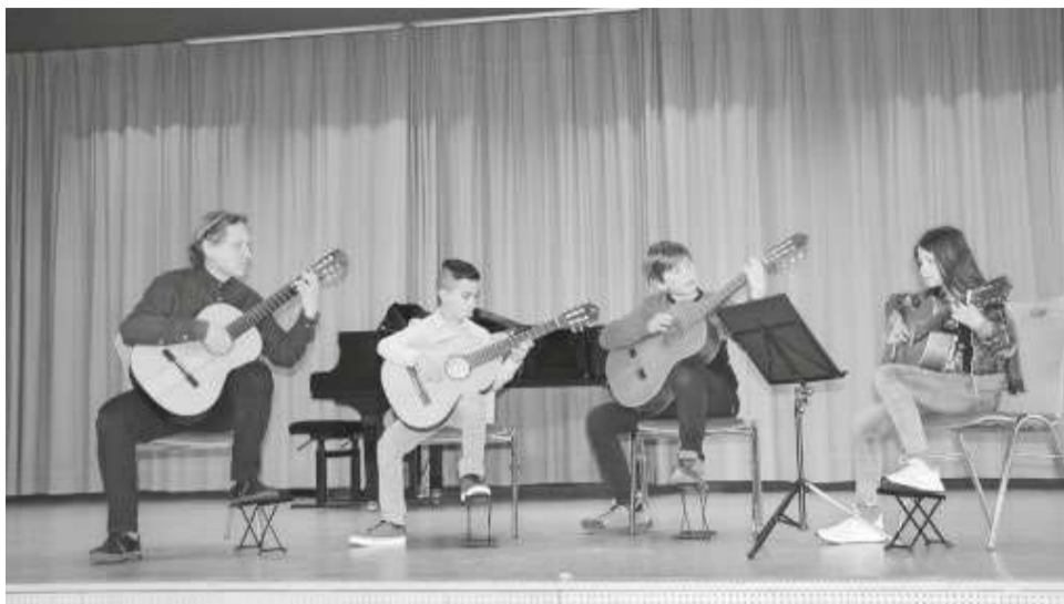
Ebenfalls werden Stücke in den unterschiedlichsten Besetzungen...

Jugend – Jugendmusikschule . Gerne sind wir auch telefonisch unter 07572 / 600 595 oder per E-Mail andre.streich@mengen.de für Sie da.