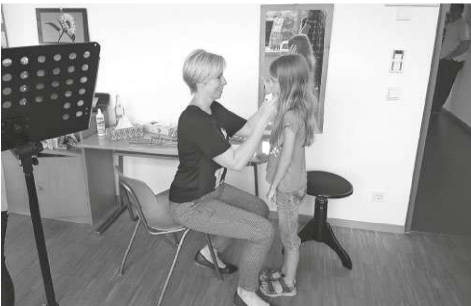
Neben Informationen rund um die Musikschule besteht für Interessenten auch...