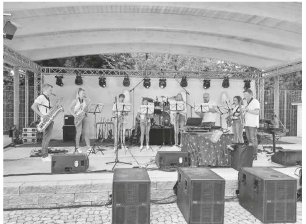
Auch das gemeinsame musizieren stellt einen wichtigen Inhalt des Unterrichts dar.

Weitere Informationen finden Sie auf der Homepage der Stadt Mengen unter www.mengen.de – Bildung – Jugendmusikschule .