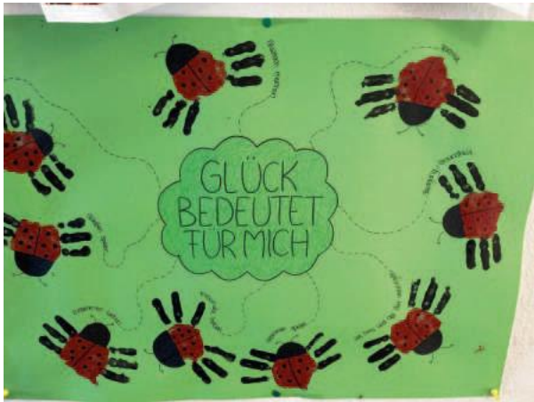
Kinderkrippe St. Christopherus Ennetach