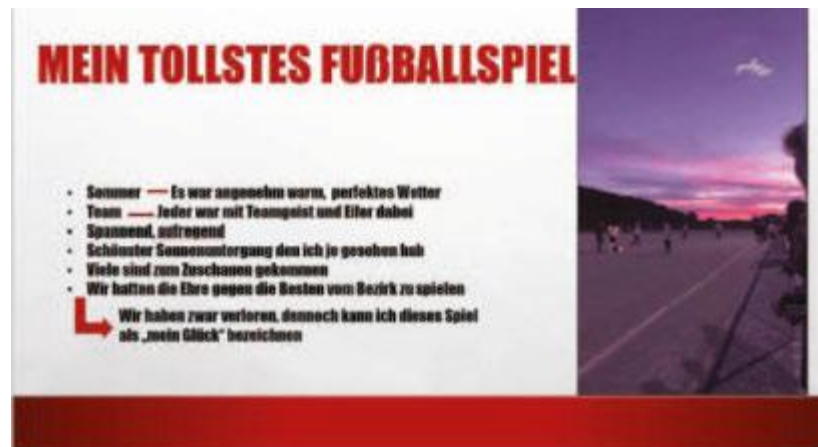
Klasse 10 des Gymnasiums Mengen