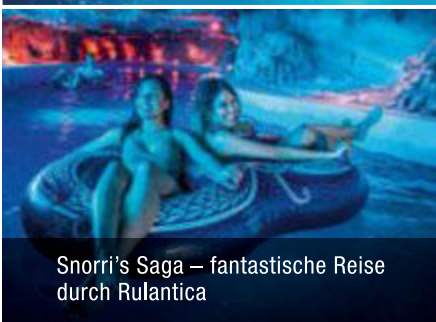
Snorri's Saga – fantastische Reise durch Rulantica