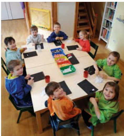
Kindergarten Löwenzahn Ruldingen