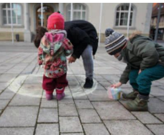
Malkreide-Aktion Jugendarbeit Mengen