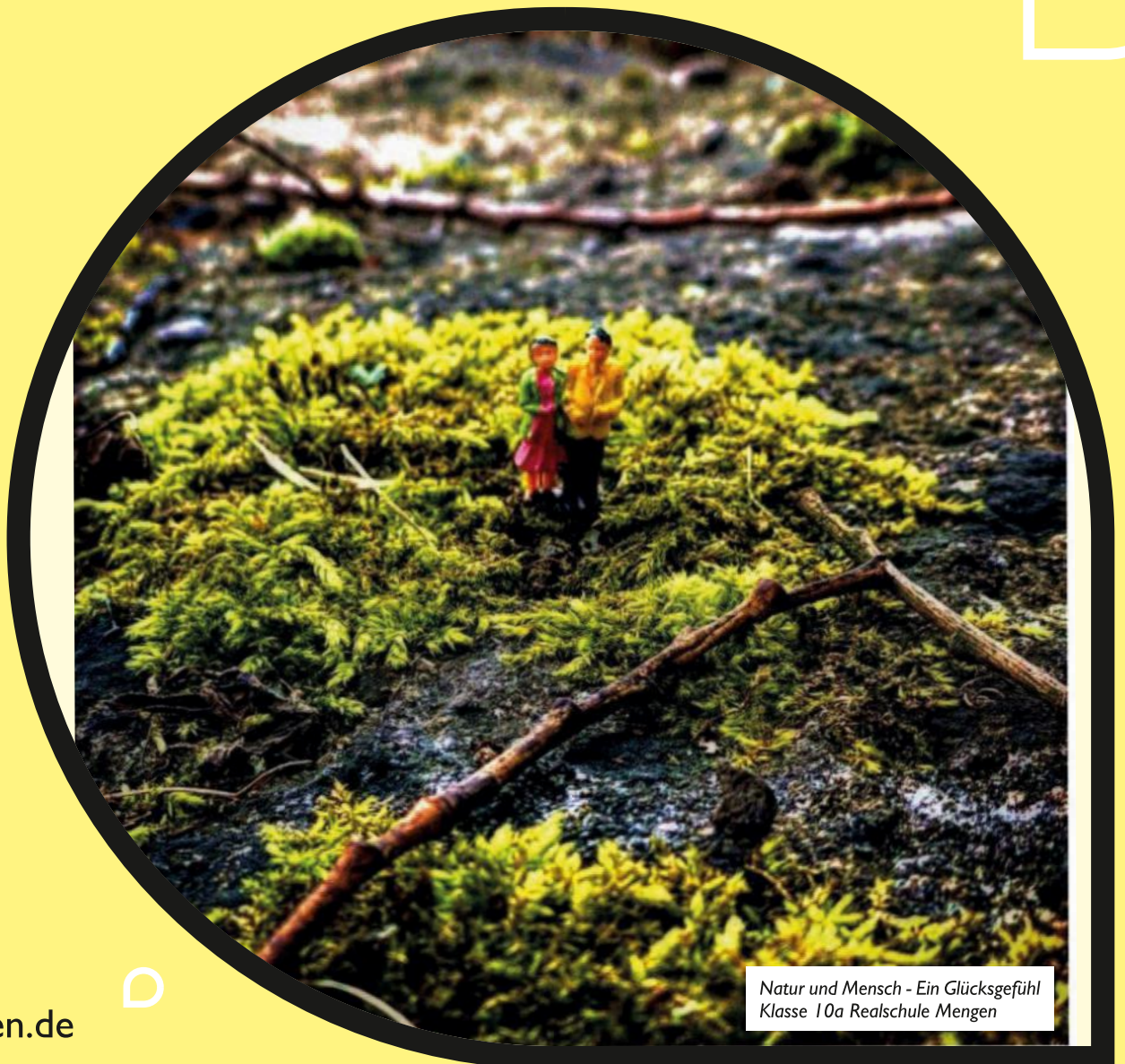
Natur und Mensch - Ein Glücksgefühl Klasse 10a Realschule Mengen