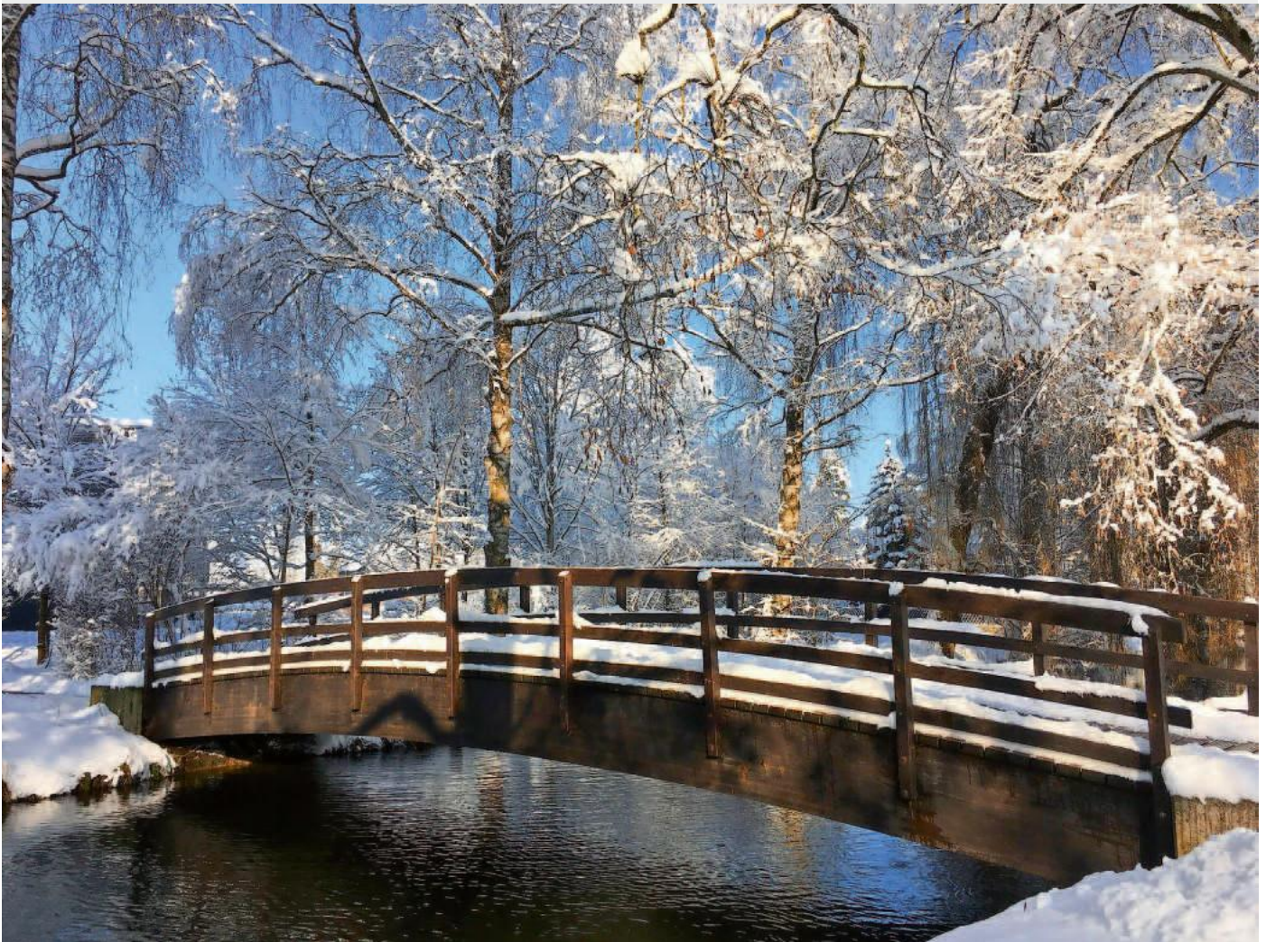
Gewinner-Foto Januar: „Brücke“; Impressionen vom verschneiten Mengen