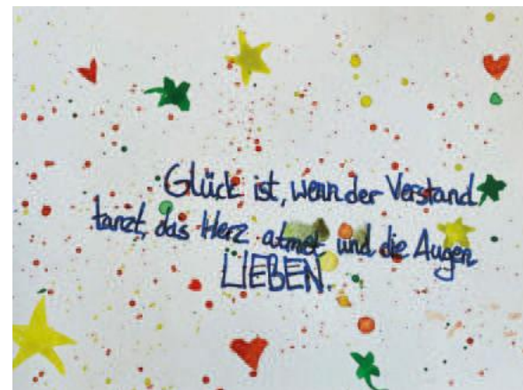
Klassen 6b und 6c der Realschule Mengen