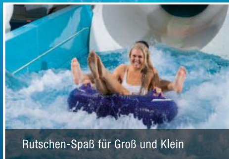
Rutschen-Spaß für Groß und Klein