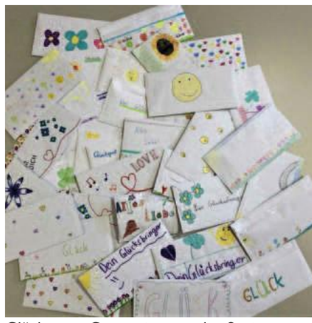
Glückspost Gymnasium an das Seniorenzentrum Mengen