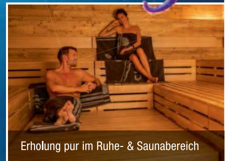
Erholung pur im Ruhe- & Saunabereich