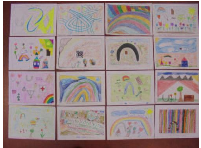
Klasse 6a der Sonnenlucherschule Mengen