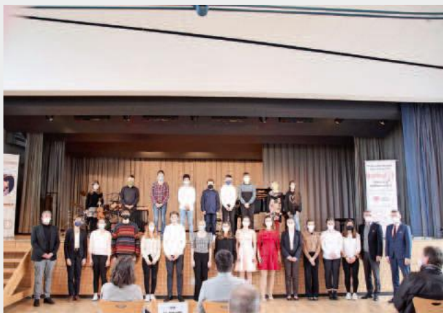
Foto 1: gemeinsames Abschlussfoto mit allen Teilnehmern sowie Ehrengästen