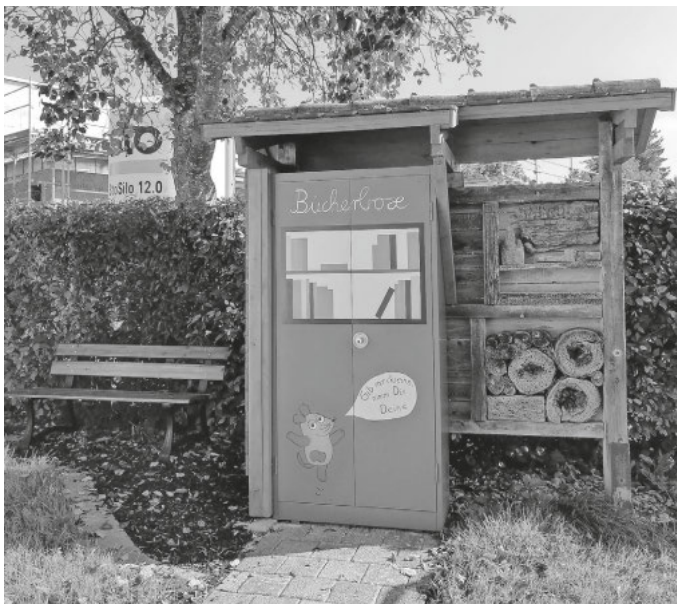
Die Bücherbox hat rund um die Uhr geöffnet. Einfach mal reinschauen: es ist für jeden Geschmack etwas dabei.

Mehrgenerationentreff Blochingen – Kooperationspartner der Fair Trade Initiative der Stadt Mengen