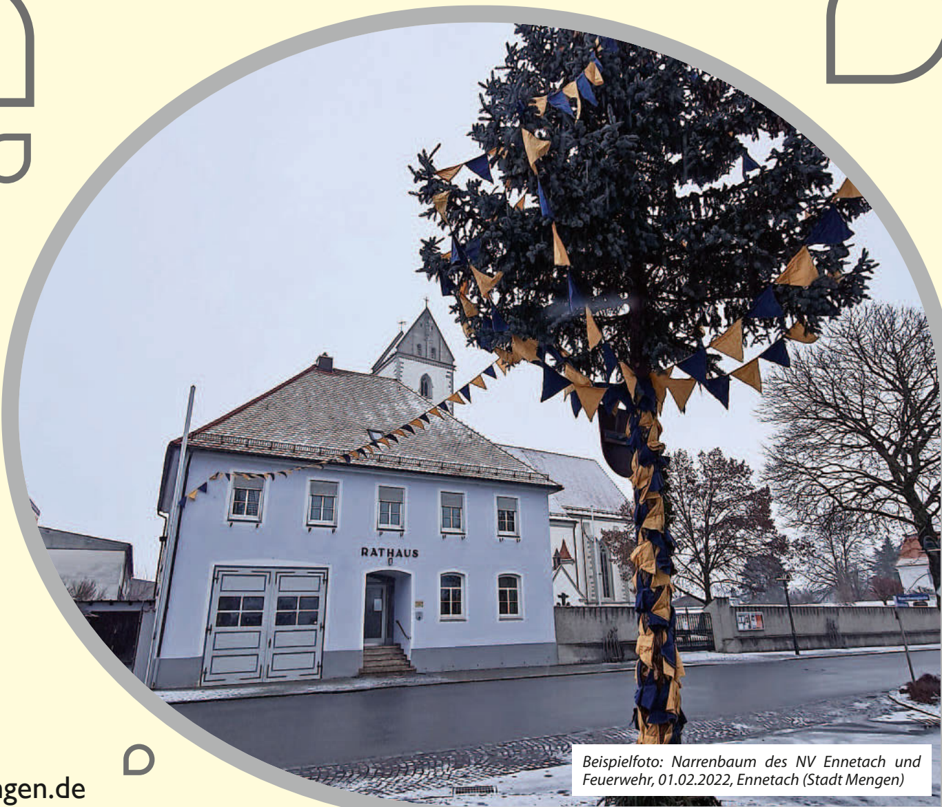
Beispielfoto: Narrenbaum des NV Ennetach und Feuerwehr, 01.02.2022, Ennetach (Stadt Mengen)

Preise für Gewinner*innen des Monats und Kalenderdruck