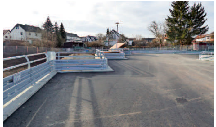
Fotos: Stadt Mengen; Einweihung des neu gestalteten Recyclinghofes in der Bussenstraße