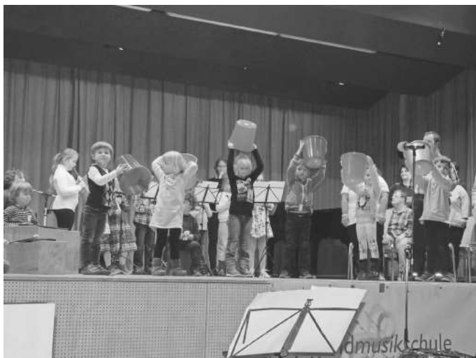
Musik hat einen wesentlichen Einfluss auf die Persönlichkeitsbildung...

Auch für die Kleinsten von 6 Monaten bis 3 Jahren bietet die Musikschule in Begleitung eines Elternteils die Möglichkeit erste Begegnungen mit der Musik zu machen. In dem Kurs „ Musik für Kleinkinder “ werden Lieder, Sprechverse, Echo-, Bewegungs- und Fingerspiele, kleine Tänze und Reigen sowie das Spiel mit einfachen Instrumenten erlernt und unterstützen so den Entwicklungsprozess schon im Kleinkindesalter .