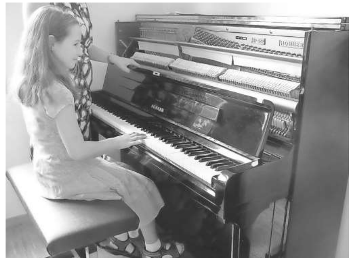
...die verschiedenen an der Musikschule zur Ausbildung angebotenen Instrumente auszuprobieren. (A. Streich)