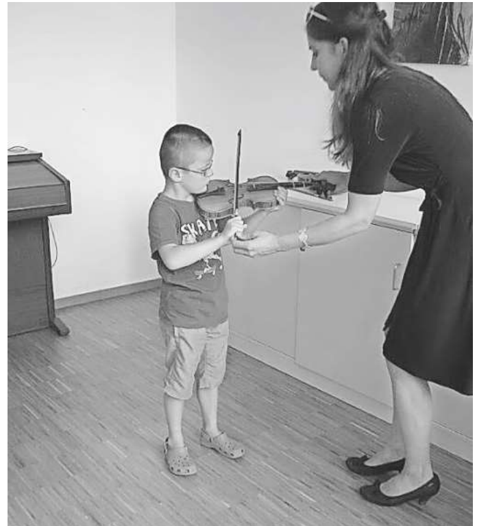
Beim „Tag der offenen Tür“ besteht für interessierte Besucher die Möglichkeit...