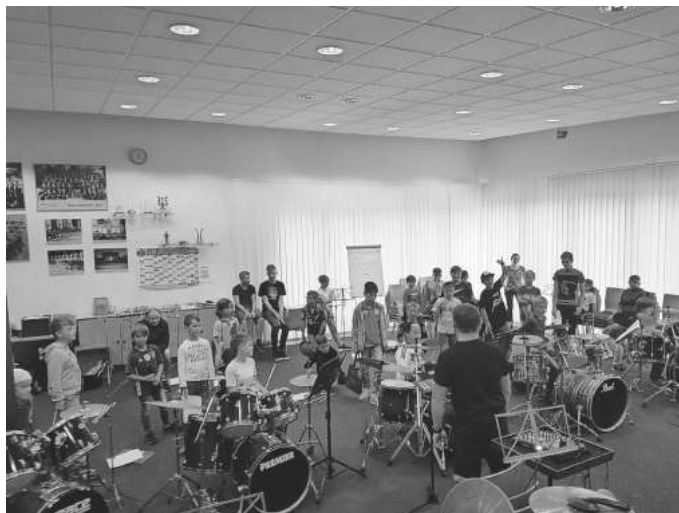
Auch das gemeinsame Proben motiviert und erhält seine Bestätigung... (A. Streich)