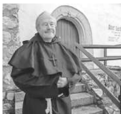
Mit Bruder Johannes die Stadt Mengen erkunden.

Bestaunen, erleben, erlauschen und genießen Sie dieses Angebot, das normalerweise nur als Gruppenangebot gebucht werden kann, ausnahmsweise während der „Klostererlebnistage Bodensee“ vom 6.-9. Oktober 2022 als öffentliche Stadtführung auch für Einzelpersonen und Familien.