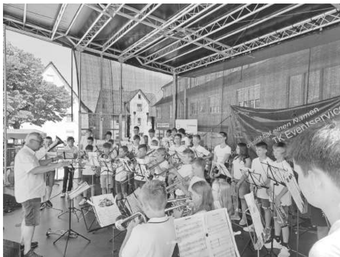
...bei den zahlreichen Veranstaltungen die von Schülerinnen und Schülern der Musikschule umrahmt werden.