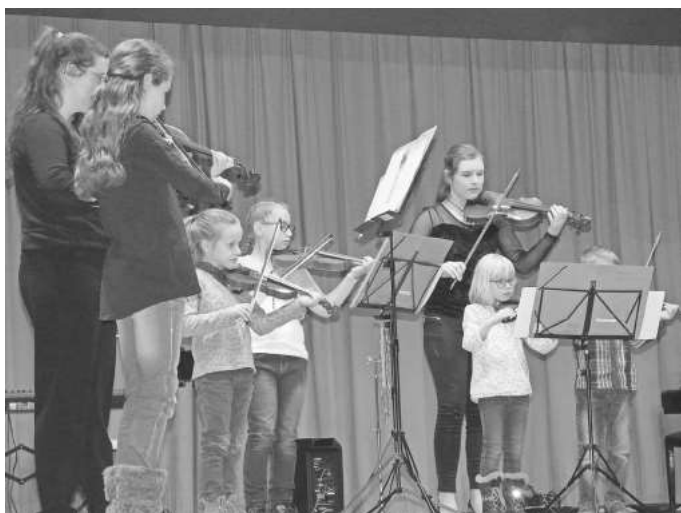
...und stellt Verbindungen zwischen den unterschiedlichen Generationen her. (Bild: K. Keppler)