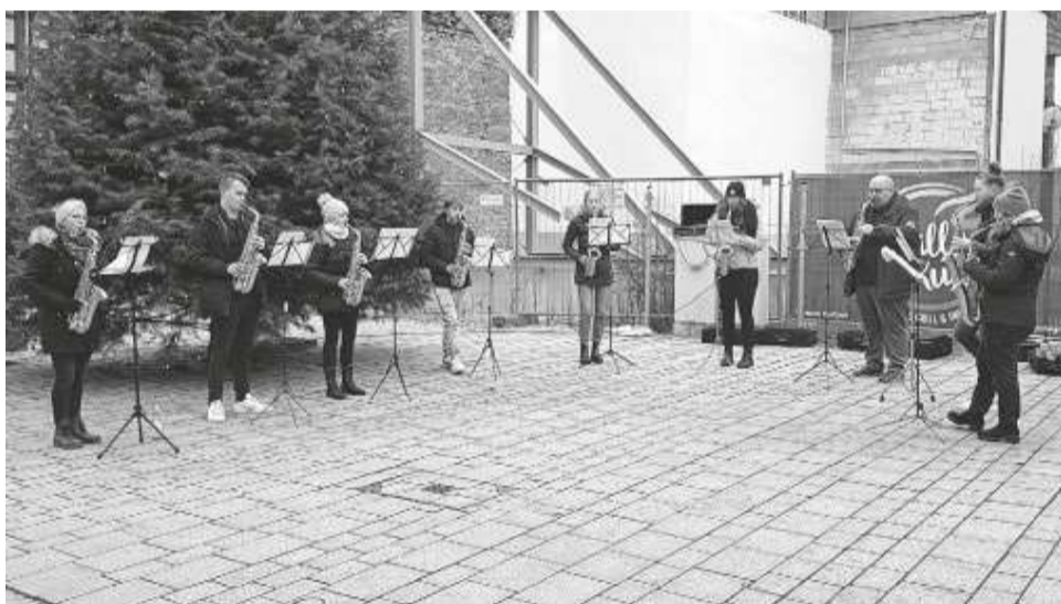
...und runden das Unterrichtsangebot der Jugendmusikschule ab.