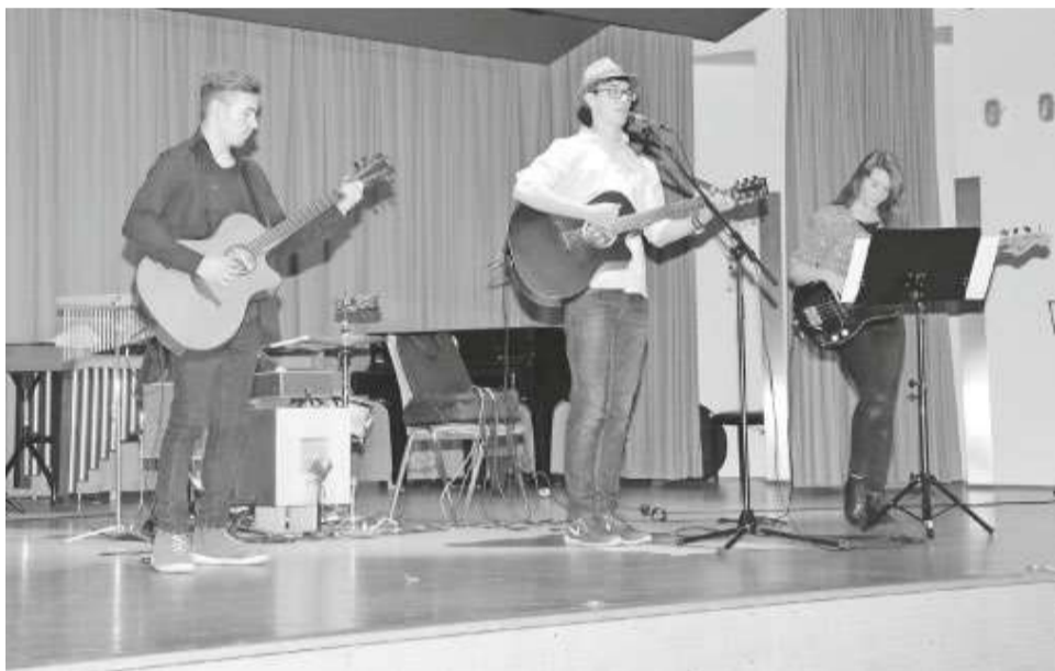
Ensemble- und Bandunterrichtsmodelle fördern das gemeinsame Zusammenspiel...

Weitere Informationen finden Sie auf der Homepage der Stadt Mengen unter www.mengen.de – Bildung – Jugendmusikschule .