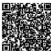
(Freiwilliges Soziales Jahr)